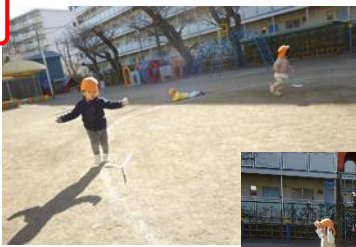
自分たちで絵を描いた凧を園庭であげました