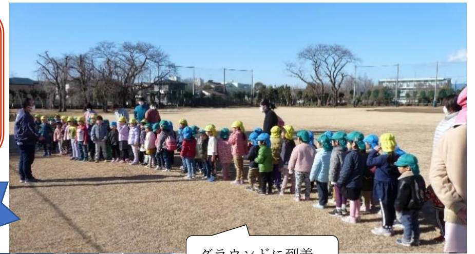
グラウンドに到着

3歳児クラス、4歳児クラス、5歳児クラスは、近くのグラウンドに行き自分たちが作った凧をあげ楽しみました。 凧あげをしてからは、広いグラウンドをお友だちと一緒に鬼ごっこをしたり、かけっこをして遊びました。