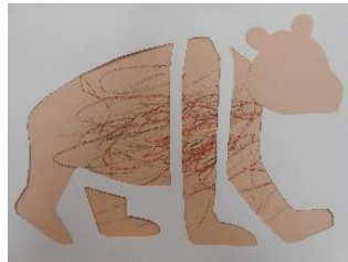
『ちやいろい くまさん』