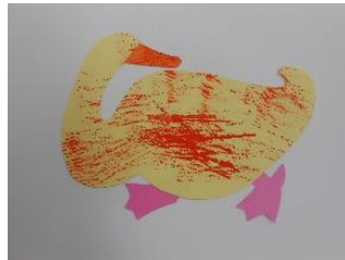
『きいろい あひるさん』

ダンボールに毛糸を巻いてスタンプを作り、アヒルの形の画用紙に押し、模様をつけました。