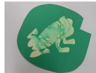
『みどりいろの かえるさん』

水性の緑と好きな1色のペンを使いなぐりがきをし、上から水のついた筆でなぞり、にじみ絵をしました。